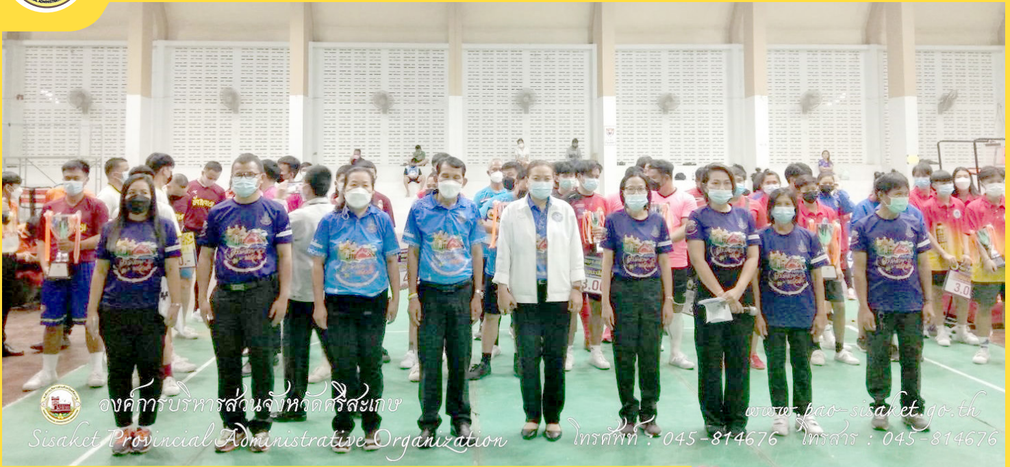
องค์การบริหารส่วนจังหวัดศรีสะเกษ Sisaket Provincial Administrative Organization www.pao-sisaket.go.th โทรศัพท์ : 045-814676 โทรสาร : 045-814676